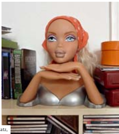
Kreativschmiede! Gudehus-Arbeitsplatz, Regalstilleben und Materialsammlung der Designerin, Gudehus-Auftritt im TV-Programm (im Uhrzeigersinn).