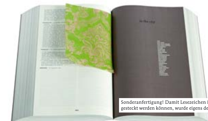
Sonderanfertigung! Damit Lesezeichen in das dicke Ding mit den dünnen Seiten gesteckt werden können, wurde eigens der oben offene „Cabrio-Schuber“ erfunden.